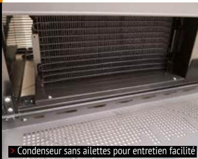
> Condenseur sans ailettes pour entretien facilité