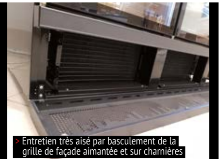
> Entretien très aisé par basculement de la grille de façade aimantée et sur charnières